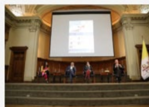
Abordar la deuda educativa, además de ser un asunto de justicia y de responsabilidad del Estado, es un problema de sostenibilidad del sistema de Educación Superior