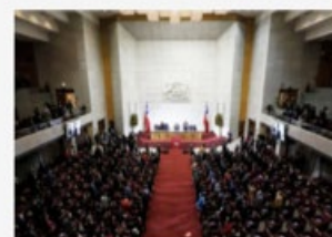
Cuenta Pública 2023: Un camino para salir del país de las deudas / El dilema de la oposición