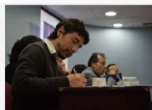
Reactivación educativa para reimaginar la educación

(Radio Universidad de Chile) y El País permitió disputar el sentido común conservador y promover una lectura progresista de la coyuntura. Este despliegue comunicacional fortaleció el vínculo entre pensamiento crítico, incidencia política y formación pública, reafirmando el papel de Nodo XXI como una plataforma intelectual y política del progresismo contemporáneo.