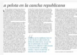
La pelota en la cancha republicana