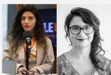
PÁGINA 13 Y MESA CENTRAL, TELE13 RADIO