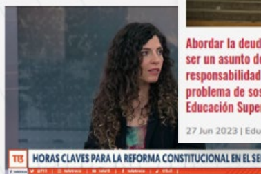
HORAS CLAVES PARA LA REFORMA CONSTITUCIONAL EN EL SE