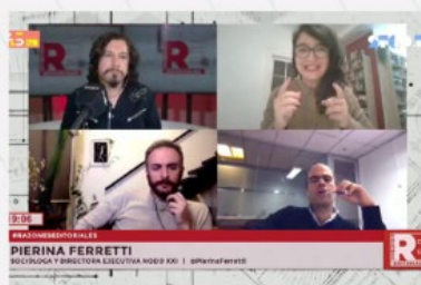
RAZONES EDITORIALES, RADIO USACH